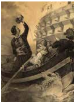
Ο Τομπάζης πυρπολεί το πρώτο τουρκικό δίκροτο στην Ερεσό (8 Ιουνίου 1821). Λιθογραφία του Peter von Hess, Μόναχο, 1852.

Είναι αδύνατον να κατανοήσουμε τον Πόλεμο της Ανεξαρτησίας χωρίς προηγουμένως να λάβουμε υπόψη μας το περιβάλλον μέσα στο οποίο γεννιέται. Και όμως οι περισσότερες μελέτες ξεκινούν από την αφετηρία ότι η κοινότητα των Ρωμιών αναδεικνύεται μέσα από τα γράμματα και το εμπόριο σε μία αυτοκρατορία που παρακαμάζει. Στην παρουσίασή μου θα επιμείνω σε μία διαφορετική οπτική: η ελληνικός πόλεμος της Ανεξαρτησίας είναι το παράπλευρο προϊόν των μετασχηματισμών που γνωρίζει από τα τέλη του 17ου και τις αρχές του 18ου αιώνα η Οθωμανική αυτοκρατορία στην προσπάθειά της να επιβιώσει στον διεθνή κρατικό ανταγωνισμό.