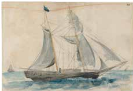
Σκούνα Κεφαλλονίτη καπετάνιο που εμπορεύεται στην Κωνσταντινούπολη. Μελάνι και υδατογραφία σε χαρτί του Γεράσιμου Πιτζιμάνου, 1818/1820.

Στα ερωτήματα αυτά επιχειρεί να απαντήσει η εισήγηση, ξεκινώντας από τα ίδια τα συνταγματικά κείμενα και προχωρώντας στην εφαρμογή και τη μη εφαρμογή τους στην πράξη.