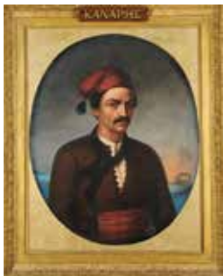
Ο Κωνσταντίνος Κανάρης. Προσωπογραφία αγνώστου καλλιτέχνη.

Στην ομιλία θα παρουσιαστούν αθηναϊκά έργα ζωγραφικής, γλυπτικής και χαρακτηριστικής που σχετίζονται με πρόσωπα και γεγονότα της Επανάστασης του 1821. Πρόκειται για προσωπογραφίες ηρώων και παραστάσεις μαχών. Μέσα από τη μελέτη των συγκεκριμένων εικαστικών συνθέσεων, θα επιχειρηθεί να φωτιστούν τόσο η γενικότερη παιδεία των καλλιτεχνών -γηγενών και αλλοδαπών- του 19ου, του 20ού αλλά και του 21ου αιώνα που τις έχουν φιλοτενήσει όσο και τα πρότυπα που εκείνοι έχουν επιλέξει, δηλαδή οι εικονογραφικοί τύποι τους. Στις προθέσεις του ομιλητή περιλαμβάνονται η επαναξιολόγηση των πραγματολογικών δεδομένων που αποτυπώνουν τα έργα, η ανίχνευση επιρροών των δημιουργών τους, ο βαθμός σύγκλισης/απόκλισης στην κλίμακα δημόσιας και ιδιωτικής σφαίρας ως προς την παραγγελιοδοσία, η υποδοχή των έργων από την τεχνοκριτική στον ημερήσιο και τον περιοδικό Τύπο, η πρόκληση γόνιμου προβληματισμού και η εξαγωγή των ανάλογων συμπερασμάτων.